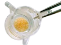
Explants de peau*

* Dans le contexte actuel, les chirurgies plastiques étant reportées, notre approvisionnement en biopsies est interrompue jusqu'à nouvel ordre. Nous vous tiendrons informés dès que nous aurons des retour sur ce modèle.